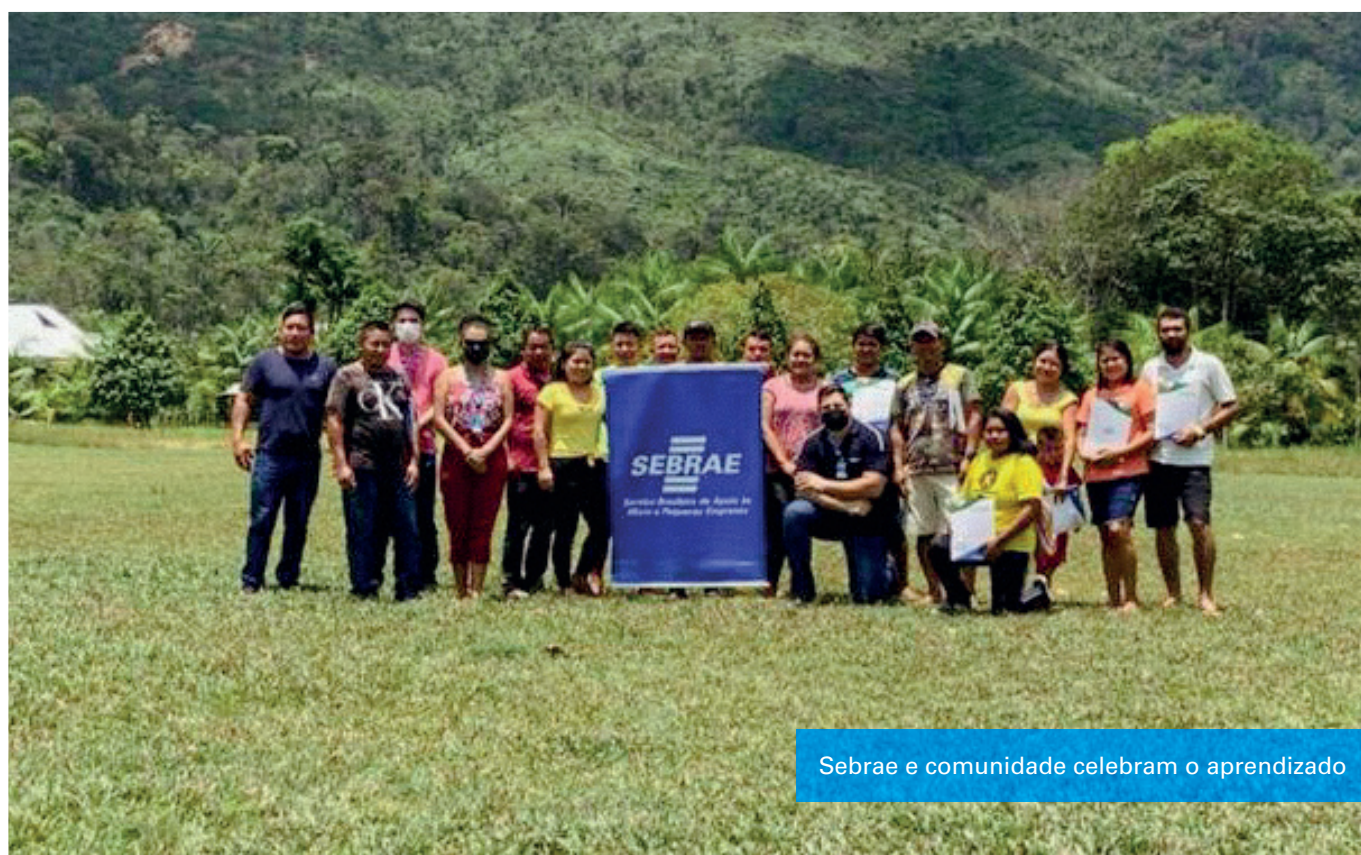
Sebrae e comunidade celebram o aprendizado