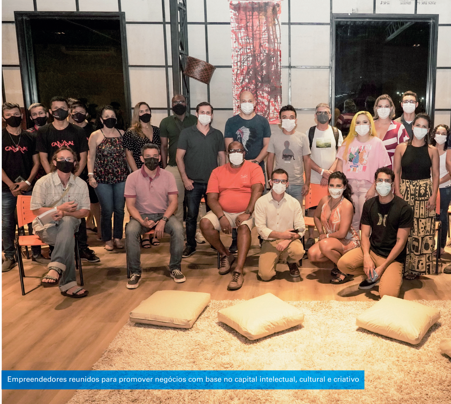
Empreendedores reunidos para promover negócios com base no capital intelectual, cultural e criativo