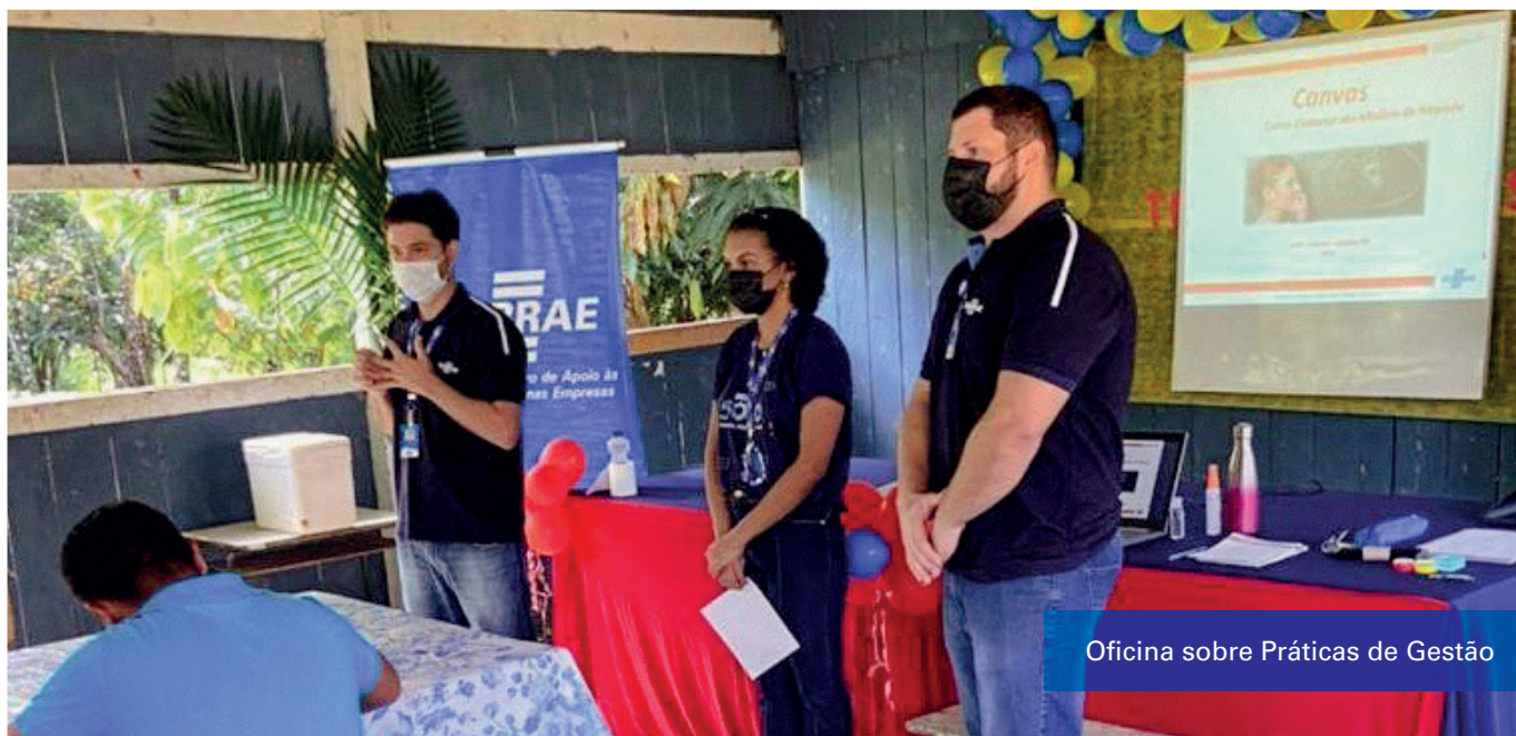
Oficina sobre Práticas de Gestão