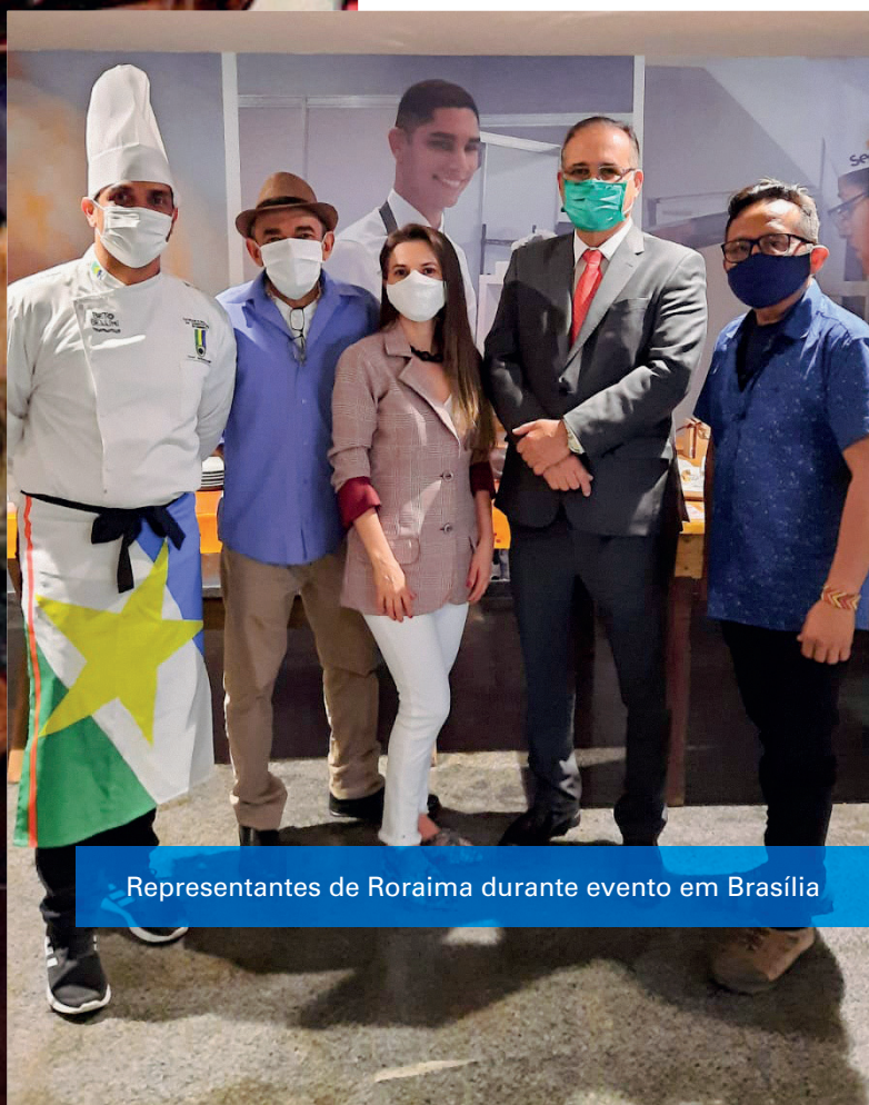
Representantes de Roraima durante evento em Brasília

Dessa vez no Sudeste, a ideia do ciclo é mostrar o trabalho, beleza, arte, poder, sol, praias, grutas, montanhas, arquitetura do estilo barroco ao ultra moderno, e a culinária globalizada da região, além da face urbana do país, que imigrantes portugueses, italianos, espanhóis, árabes, alemães, orientais, entre outros, ajudaram a construir e misturar.