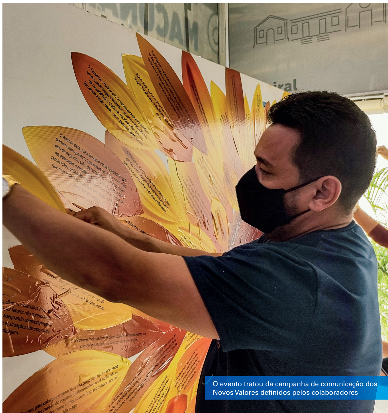
O evento tratou da campanha de comunicação dos Novos Valores definidos pelos colaboradores