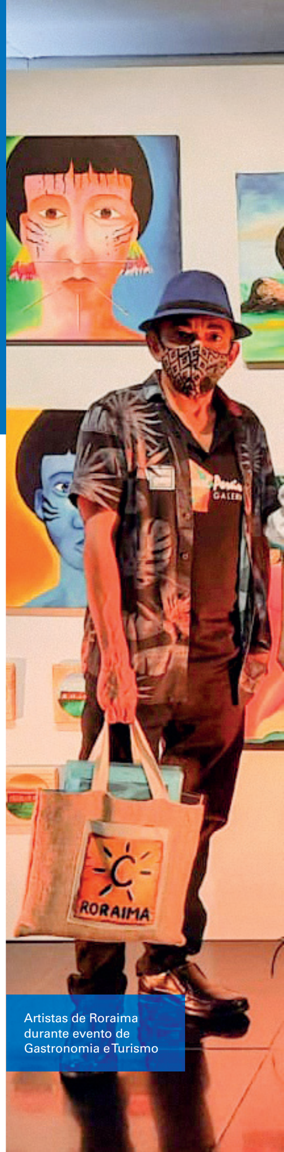
Artistas de Roraima durante evento de Gastronomia e Turismo

O Sebrae tem sido uns dos protagonistas nessa fase de retomada do turismo diante do cenário de pande-